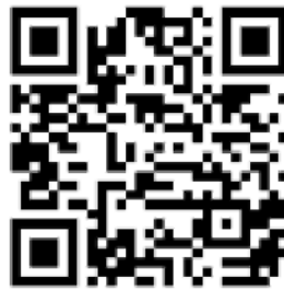
Рисунок 6 — Рекомендации по проведению кинопоказов в профилактике

Среди фильмов по тематике противодействия терроризму можно использовать следующие фильмы: «Беслан. Память» (Россия, 2014 г., возрастное ограничение: 12+), «Кавказский пленник» (Россия, 1996 г., возрастное ограничение: 18+), «Я не террорист» (Узбекистан, 2021 г., возрастное ограничение: 18+), «Отель Мумбаи: противостояние» (США, Австралия, 2018 г., возрастное ограничение: 18+) и т.д.