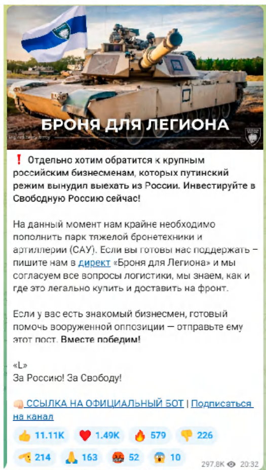
Рисунок 3 — Скриншот телеграм-канала легиона «Свобода России» с призывом к финансированию

Важно подчеркнуть, что помимо собственно пропаганды и распространения идеологии террористических организаций, а также вовлечения в деятельность террористических организаций существует еще одна угроза террористического характера — ложные сообщения о готовящемся террористическом акте. Только за 2021 год зафиксировано более 4,5 тысяч ложных сообщений о готовящихся терактах на объектах социальной инфраструктуры. Это может быть хулиганство, злой умысел, специфическое чувство юмора, желание проверить качество работы правоохранительных органов или антитеррористическую защищенность объекта и др. Во всех вышеперечисленных случаях за такой поступок придется нести уголовную ответственность. Ведь злоумышленник нарушает конструктивную деятельность общественных объектов, а правоохранителям приходится задействовать множество средств и сил, чтобы проверить объекты, которые якобы находятся под угрозой. За ложное сообщение о готовящемся теракте правонарушитель может быть наказан либо штрафами – от 200 тысяч рублей и до двух миллионов рублей, либо лишением свободы – от одного года до 10 лет. Ответственность за данный вид правонарушения наступает с 14 лет (статья 207 УК РФ «Заведомо ложное сообщение о акте терроризма»).