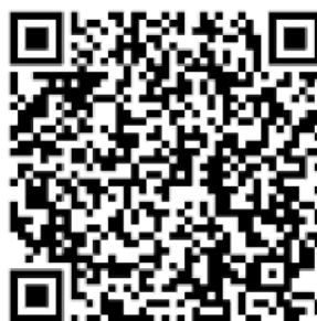
Рисунок 4 — Сценарий для проведения дебатов «Идеология радикализма»

Первая команда всегда будет представлять сторону радикальной идеологии. Задача команды студентов – найти контраргументы тех радикальных и спорных тезисов, которые будет озвучивать первая команда. Тем самым, участники будут вынуждены критически рассматривать постулаты радикальных идеологий, искать в них логические ошибки, несоответствия – самостоятельно приходиться к выводу о деструктивности любой радикальной идеологии (см. рисунок 4).