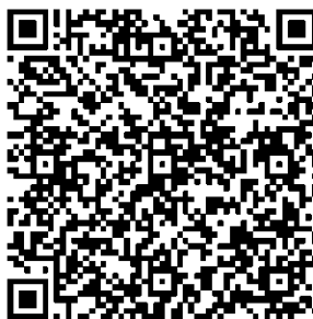
Рисунок 7 — Сценарий тематической викторины с примерами вопросов

В каждом из перечисленных мероприятий важно отслеживать активность участников, высказываемыми ими мнения, их настрой в целом. На таких мероприятиях необходимо присутствие психолога для фиксации активности и оценки их поведения.