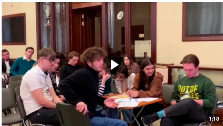
Дебаты «Идеология радикальных организаций» 1 888 просмотров

В рамках дебатов можно: развенчивать мифы, декларируемые представителями радикальных идеологий для вербовки; развивать навыки критического мышления и ведения дискуссии; формировать в целом антитеррористическое сознание и активную гражданскую позицию. Рекомендуется для мероприятия вовлекать не более 20 человек (см. рисунок 5).